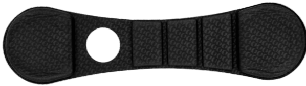
Correa con peso